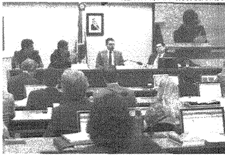
O secretário da Receita, José Tostes, anuncia Reforma Tributária do governo, que trará a volta da tributação de lucros e dividendos

Segundo José Tostes, a reforma deve manter a carga tributária atual, mas vai conter uma perspectiva de redução no longo prazo, e vai tratar apenas dos tributos federais. Também haverá uma negociação para a adesão de estados e municípios. A proposta do Planoalto, de acordo com o secretário da Receita Federal, vai buscar, ainda, uma solução para reduzir as perdas de estados com a atividade mineradora - o setor atualmente é isento de tributação. Segundo ele, essa situação impede o estado do